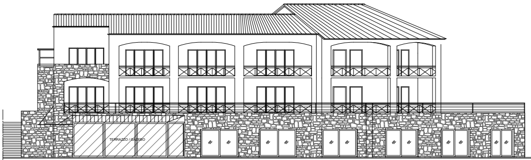
Prospetto Ovest approvato