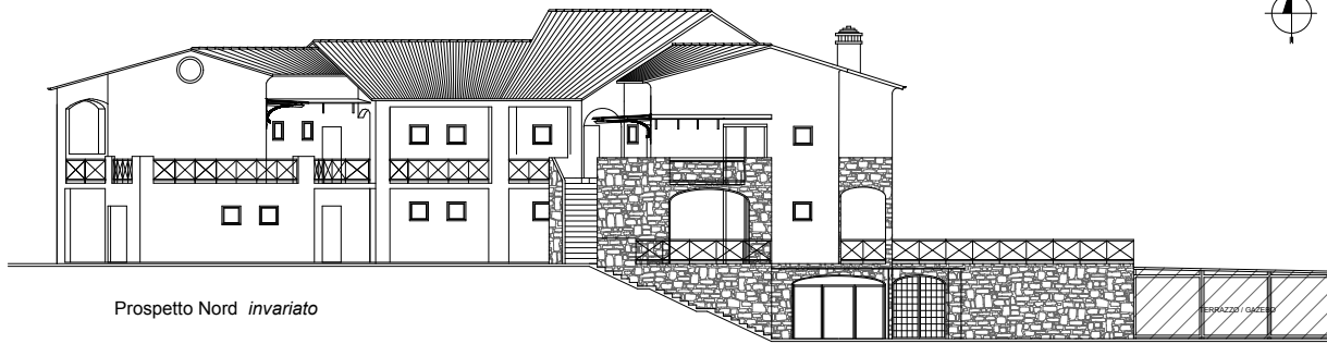
Prospetto Nord invariato