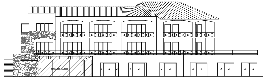
Prospetto Ovest di progetto