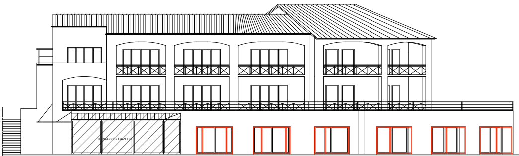
Prospetto Ovest di raffronto